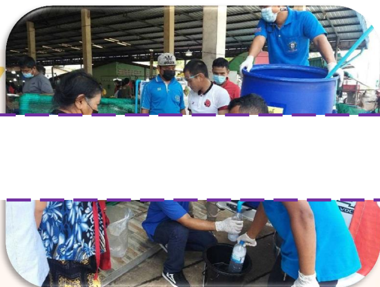
ดำเนินการ