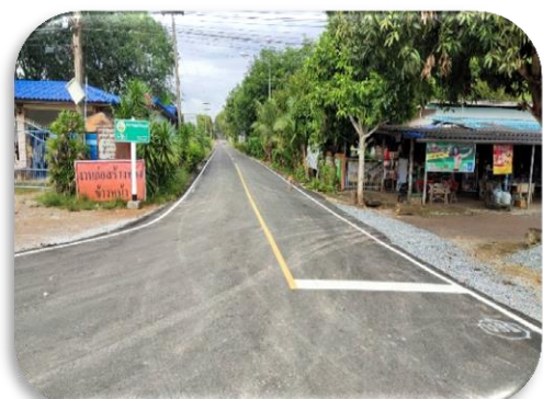
การแล้วเสร็จ