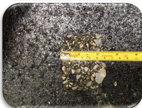
ภาพ ดำเนินงาน